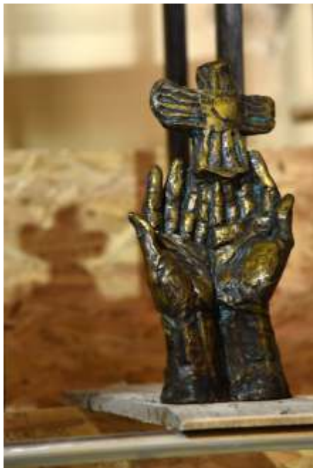
„Rinascere piu gloriosa“

skulptura, patinirana pečena glina, 45 x 30 x 15 cm