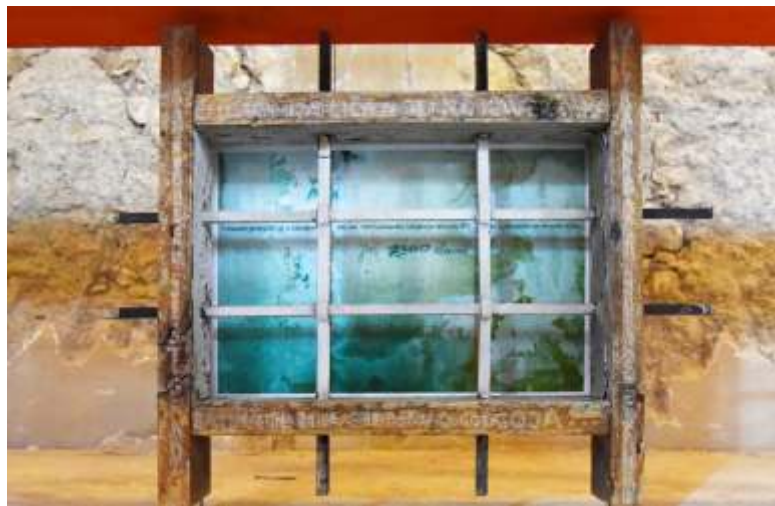
„Hommage slobodi“ ready-made instalacija, 70 x 90 x 20 cm