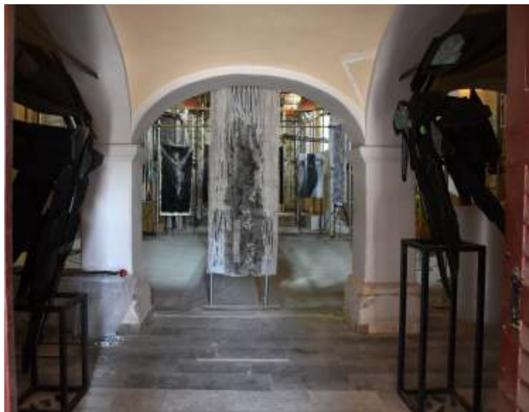
„Sv. Franjo Ksaverski“ kombinirana tehnika na platnu, 220 x 80 cm