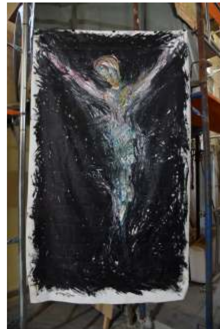
„Uskrsnuće“ akril na platnu, 200 x 115 cm