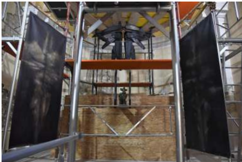
„Lux Aeterna“, 3 skulpture, drvo, metal, 230 x 175 x 50 cm „Otisak Nebesa I i II“, akril na platnu, 210 x 100 cm

na naslovnici: detalj centralne skulpture Lux Aeterna