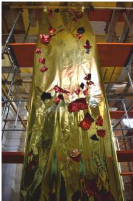
„Fenix / Uzlet“

skulptura, patinirana pečena glina, 45 x 30 x 15 cm