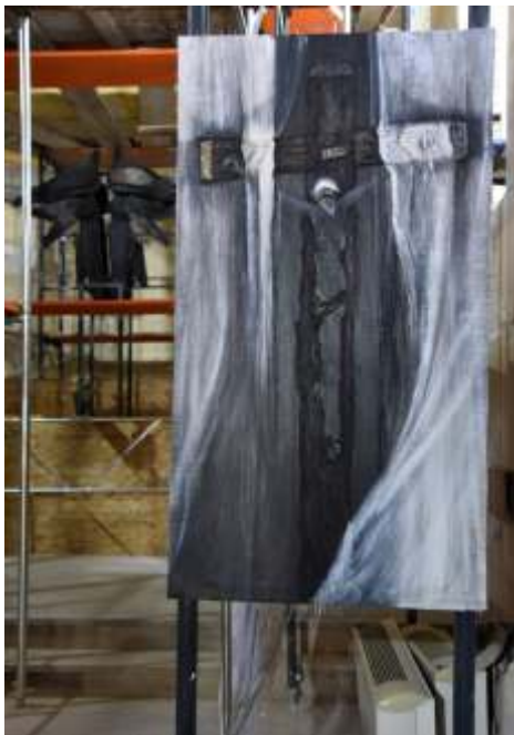
„Uskrsno svjetlo Golgote“ keramičko ljepilo, akril i ulje na platnu, 162 x 79 cm