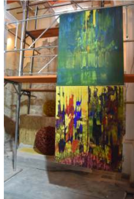
„Metamorfoza I i II“ akril i ulje na platnu, 120 x 100 cm(x2)