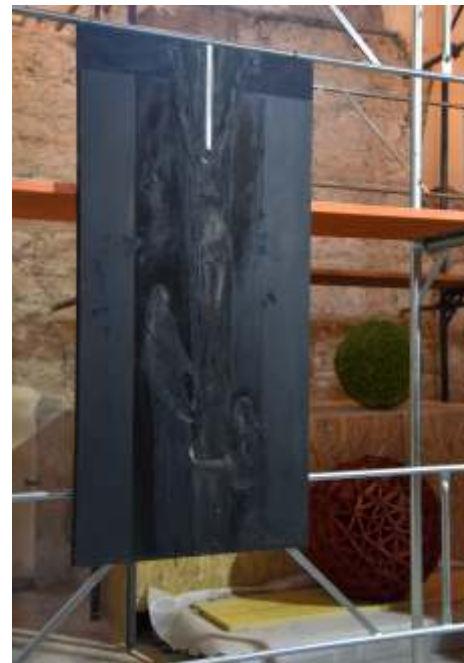
„Isusova smrt razdire hramsku zavjesu“ keramičko ljepilo, čavli, akril na platnu, 140 x 78 cm